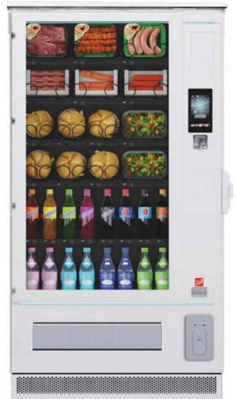
SiLine Combi M RO

* Abweichungen der Gehäuseabmessungen sind aufgrund von Anbauteilen und Zubehör möglich. Energieeffizienz aller Typen unter www.sielaff.de/produkte/energieverbrauchskennzeichnung