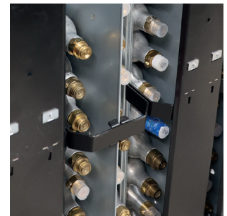
Hohe Kapazität mit Platz für bis zu 140 Zylindern