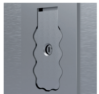
Der gewellte Sperrklappenschutz schützt die SiLine® Serie vor Aufstemmen oder Aufhebeln