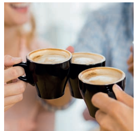
Die ausgezeichnete Kaffeequalität und große Produktvielfalt überzeugen