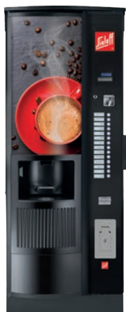
CIS/ CVS 500 RB RO Design A