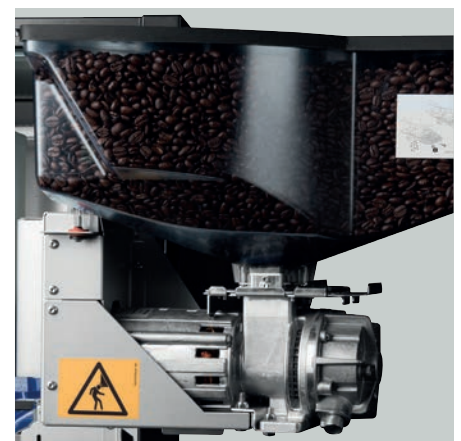
Hochwertige Komponenten aus dem HoReCa-Bereich