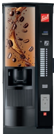
CIS/ CVS 500 RB RO Design B