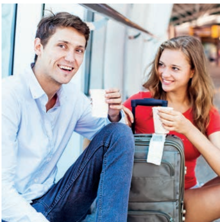
Perfekt und individuell abgestimmt auf die unterschiedlichen Ansprüche

Das Ergebnis: Ein Outdoorgeeigneter Kaffeeautomat, der nicht nur hervorragenden Kaffee liefert, sondern auch durch Zuverlässigkeit und Sicherheit überzeugt – rund um die Uhr, das ganze Jahr über.