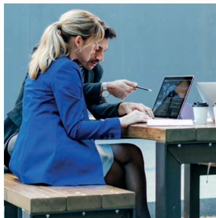
Besten Genuß Draußen, wenn das Wetter sich für ein Treffen im Park eignet