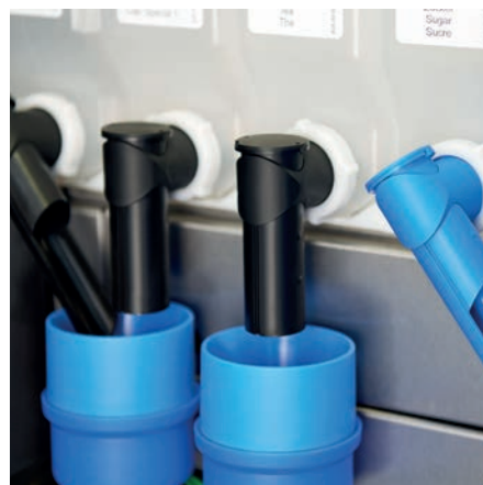
Für den individuellen Einsatz sorgt die hohe Variantenvielfalt