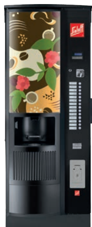
CIS/ CVS 500 RB RO Design C