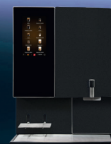
Siamonie Smart OCS RAL 9005 HR Mono | Duo