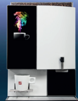
Zahlung | payment | paiement OCS XL RAL 9005 FSM

Technische Änderungen und Irrtümer vorbehalten. Alle Abbildungen sind beispielhaft und können Sonderausstattungen beinhalten. Technical data are subject to change without notice. Errors excepted. All images shown are examples and may include optional extras. Sous réserve de modifications techniques et d'erreurs. Toutes les illustrations sont à titre d'exemples et peuvent montrer des équipements optionnels.