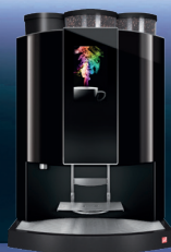
Siamonie TS RAL 9005 HO