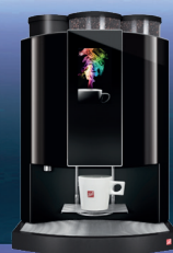
Zahlung | payment | paiement RAL 9005 HO (RAL 9003) Tassen | cups | tasses