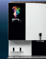
Siamonie Smart OCS XL RAL 9003 Mono | Duo