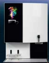
Siamonie Smart OCS RAL 9003 Mono | Duo