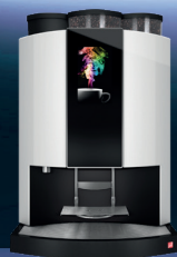
Siamonie TS RAL 9003