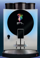
Siamonie ML RAL 9003