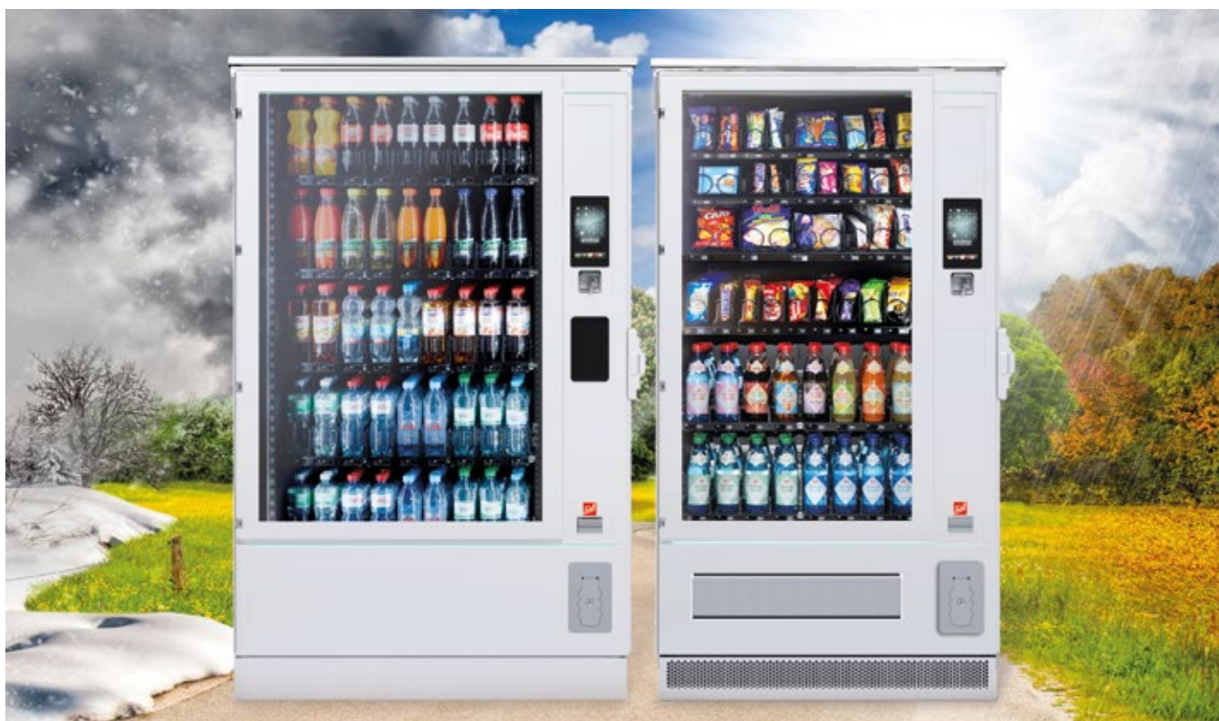
SiLine® GF L RO en couleur standard RAL 9010

SiLine® Outdoor : une prise électrique et le tour est joué, les distributeurs sont prêts à vendre par tous les temps.