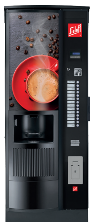
CIS/CVS 500 RB RO design A