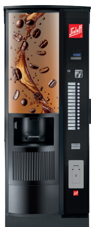
CIS/CVS 500 RB RO design B