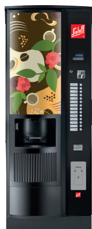
CIS/CVS 500 RB RO design C